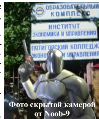
Фото скрытой камерой от Noob-9

Ждите следующий выпуск. СКОРО! В НАШЕЙ ГАЗЕТЕ!